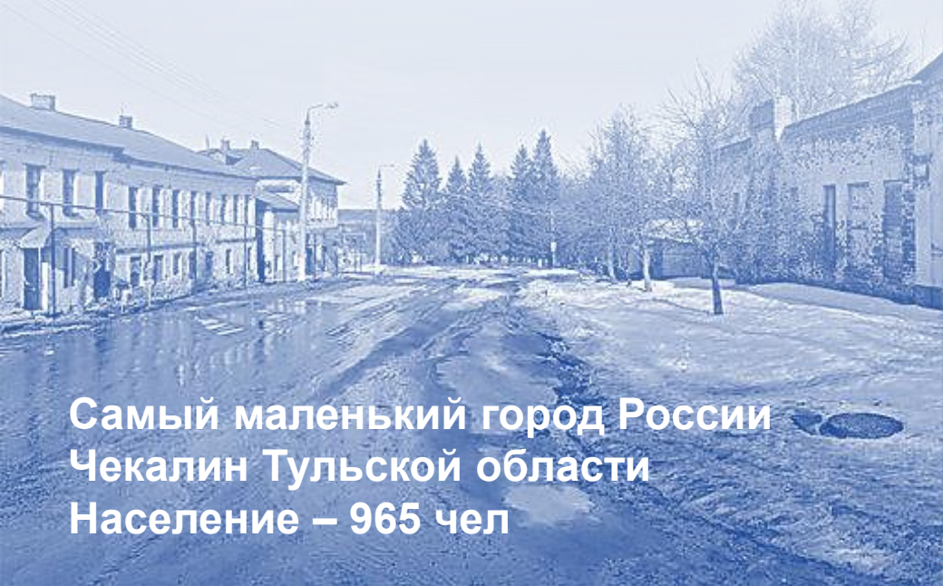
Самый маленький город России Чекалин Тульской области Население – 965 чел